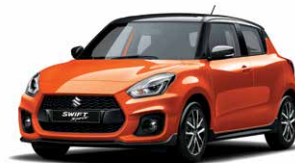
Flame Orange Pearl Metallic / Super Black Pearl Metallic (CFK)