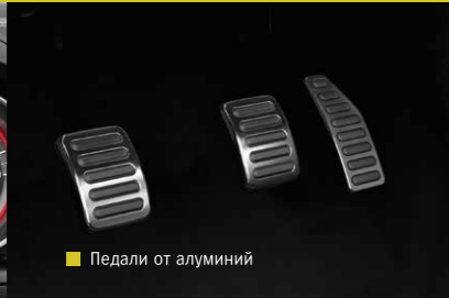
Педали от алуминий