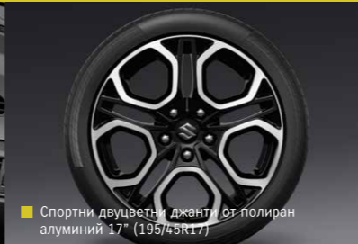
Спортни двувъетни джанти от полиран алуминий 17" (195/45R17)