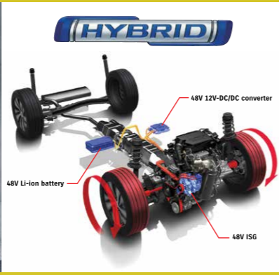
48V Li-ion battery, 48V 12V-DC converter, 48V ISG