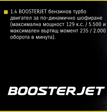
1.4 BOOSTERJET бензинов турбо двигател за по-динамично шофиране (максимална мощност 129 к.с. / 5.500 и максимален въртящ момент 235 / 2.000 оборота в минута).