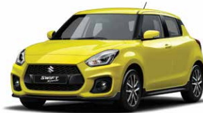
Champion Yellow Metallic (ZFT)