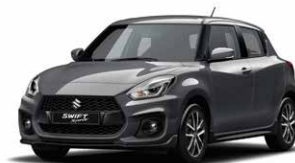
Mineral Gray Metallic (ZMW)