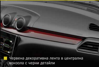
Червена декоративна лента в централна конзола с черни детайли