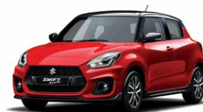
Burning Red Pearl Metallic / Super Black Pearl Metallic (D7Z)