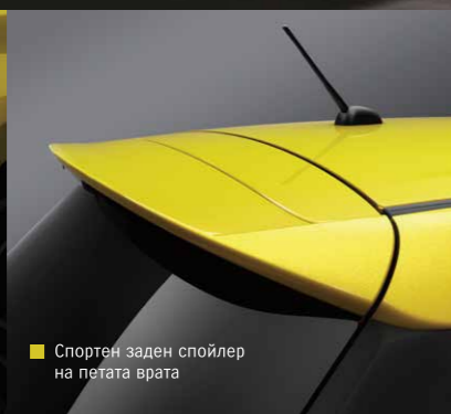
Спортен заден спойлер на петата врата