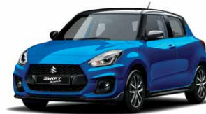
Speedy Blue Metallic / Super Black Pearl Metallic (C7R)