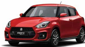
Burning Red Pearl Metallic (ZWP)