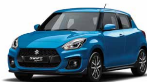
Speedy Blue Metallic (ZWG)