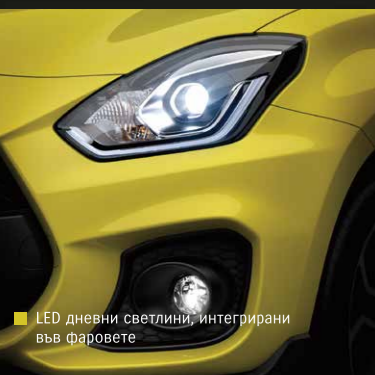
LED дневни светлини, интегрирани във фаровете