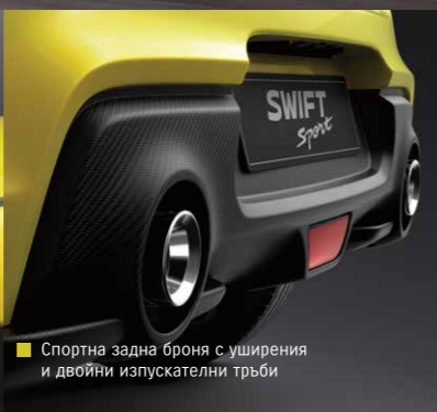
Спортна задна броня с уширения и двойни изпускателни тръби