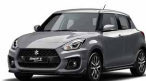
Premium Silver Metallic (ZNC)