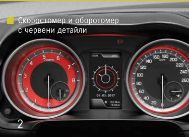
Скоростномер и оборотомер с червени детайли