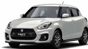
Pure White Pearl Metallic (ZVR)