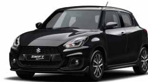
Super Black Pearl Metallic (ZMV)